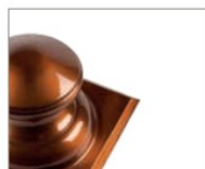
Cuivre vieilli laqué