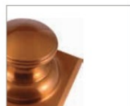
Cuivre poli laqué